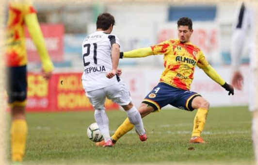
Fază din meciul disputat în toamna anului trecut.

29 Noiembrie 2020, Timișoara, Ripensia – Astra Giurgiu, 1-5 (1-1), Cupa României, Șaisprezecimi În toamna anului trecut, s-a disputat și prima partida între cele două echipe pe Stadionul Electrica, meciul a coincis cu revenirea Ripensiei după perioada de izolare, cauzată de pandemia de Covid19. După o primă repriză în care Ripensia a făcut față echipei Astra, pe atunci în Liga I, echipa a căzut fizic după pauză, iar "astralii" au defilat câștigând cu 5-1 la final, ba chiar mergând până în finala Cupei României, pierdută însă cu cei de la CS Universitatea Craiova, 2-3 după prelungiri.