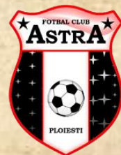
Astra Ploiești 2009-2012

După revenirea în Liga I, clubul joacă în primele 3 sezoane la Ploiești 2009-2012, urmând ca din sezonul 2012-2013, să se mute la Giurgiu pentru disputarea meciurilor de acasă, devenind Astra Giurgiu însă în continuare echipa se antrenează la Ploiești.