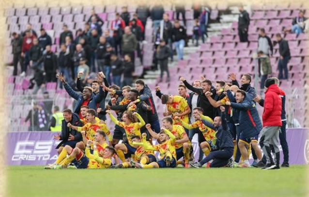
Celebrarea victoriei după derby.