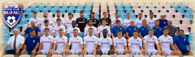
Echipa din Crâng (FC Buzău).